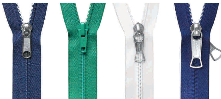
ems K fulda K iller K, N double iller K, N

Zdjęcia suwaków nie odpowiadają ich rzeczywistym rozmiarom.