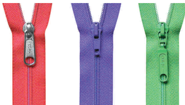
ems K, N, M fulda K, N sport K