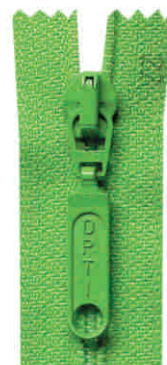
sport K, N, SN, SM