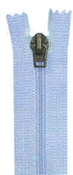
stirrup N, M, SN, SM