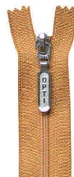
sport N, SN, SM