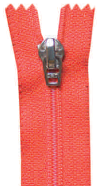
stirrup N, M, SN, SM