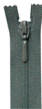
pendant K, N, M, SN, SM