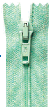
fulda K, N

Rodzaj materiału: poliester Szerokość taśmy: 16 mm x 2 Szerokość spirali: 6 mm Wysokość spirali: 1,9 mm