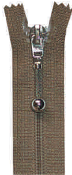
foxtail N, M, SM

Rodzaj materiału: poliester (poliamid) Szerokość taśmy: 12 mm x 2 Szerokość spirali: 4 mm Wysokość spirali: 1,5 mm