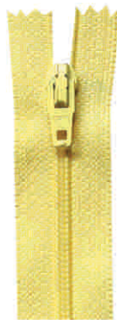
optimatic K, N, SN, SM, B