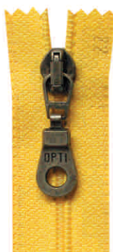
mosel N, M, SN, SM